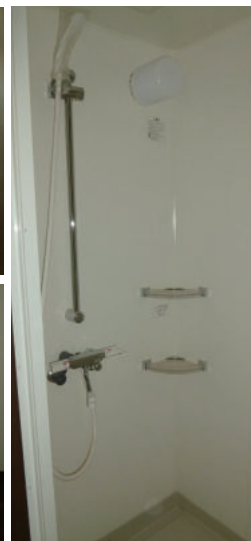
※図面と現況が異なる場合は現況を優先とします。