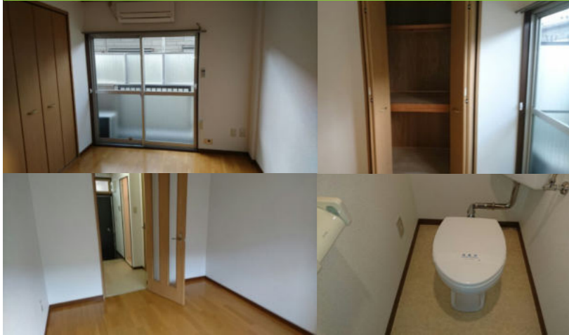
※写真は現入居者入居前のものです。

▶JR 京浜東北線『大森』駅 徒歩 12分 ▶京浜急行線『平和島』駅 徒歩 17分